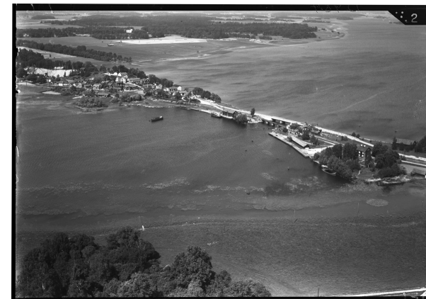
Flygfoto över Borgåsunds hamn 1935.

År 1862 invigdes en ny hamn med bryggor och magasin på båda sidor om sundet. Järnmagasinet byggdes 1872 och användes