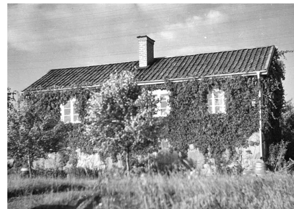
Brovaktarstugan 1948. Kolbäckens Hembygdsförening

främst för stångjärn från hyttor och bruk i Bergslagen. I magasinet hade bruken egna fack, där järnet förvarades i väntan på vägning och utskeppning.