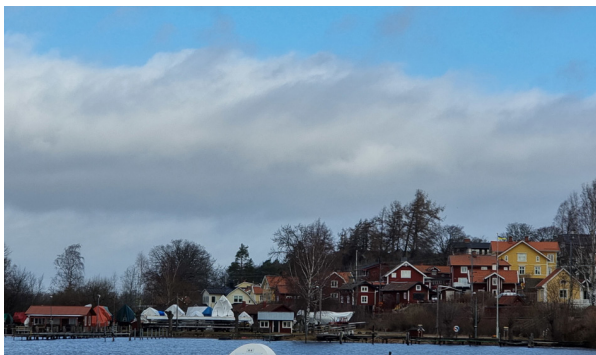
Borgåsunds småbåtshamn norr om sundet.

Vågmästaren hade en särställning och ansågs vara byns högsta myndighet. Huset är idag i privat ägo.